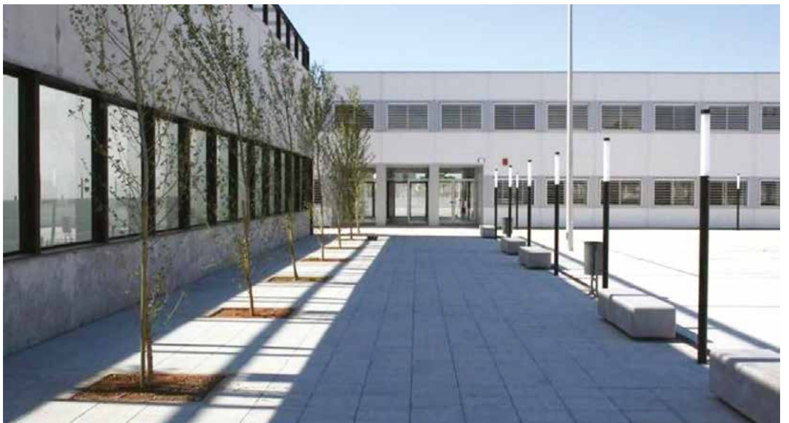
Part del pati del IES San Antoni de Benagèber.

La Asamblea de Professorat Corrector de les Proves de la PAU [Asamblea del Profesorado Corrector de las pruebas de la PAU] de la Comunidad Valenciana, formada por 250 profesores de Bachillerato con especialidad, ha advertido este martes de que están considerando no presentarse a la constitución de los tribunales examinadores el próximo 2 de junio, renunciar en bloque ese día o adoptar acciones "más contundentes" respecto a las calificaciones, llegado el momento. El motivo es el "estancamiento de las negociaciones" durante la huelga indefinida del profesorado público no universitario de esta autonomía, según un comunicado. La Generalitat valenciana ha respondido con un mensaje de tranquilidad para los estudiantes y ha asegurado que la PAU "se va a celebrar en condiciones de normalidad" porque hay profesorado suplente suficiente.