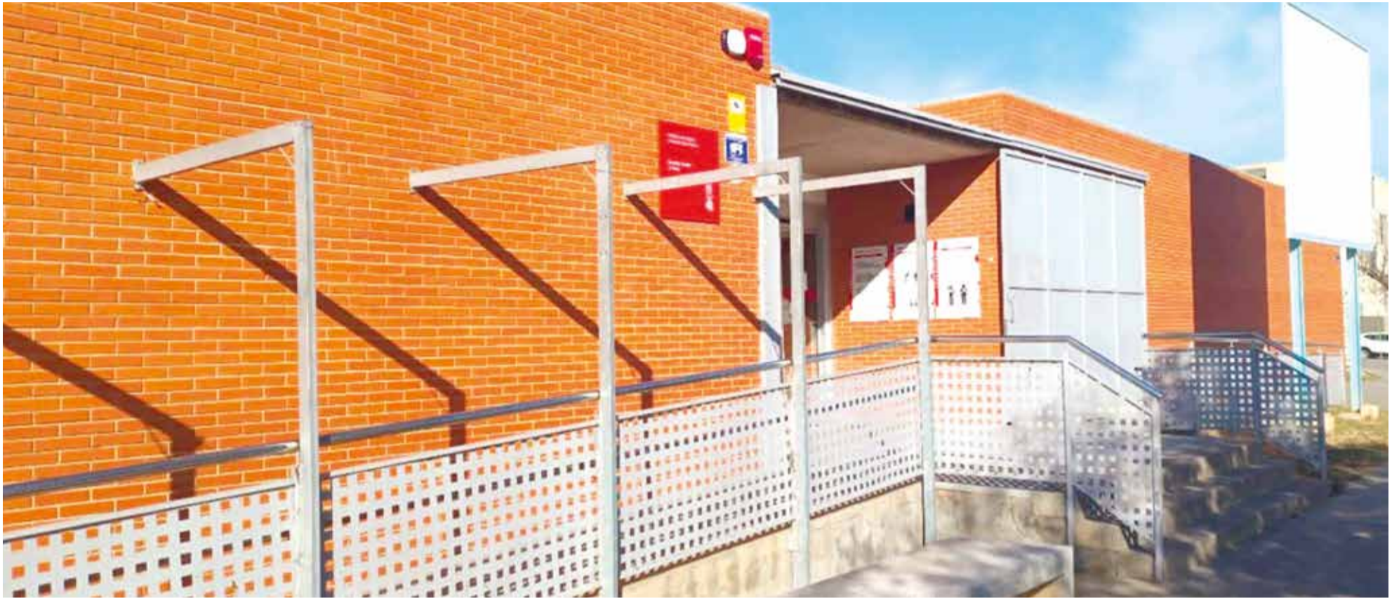
Façana de l'edifici del centre de salut de La Coma de Paterna.

La Conselleria de Sanitat restablirà el servei de Pediatria en el centre de salut de La Coma dilluns que ve, 1 de juny, amb la incorporació de dos pediatres a jornada completa i una infermera de Pediatria.