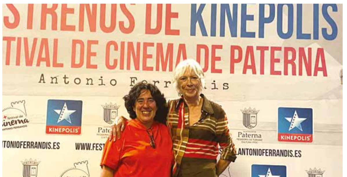
La directora de la película junto a una de sus actrices, natural de Xirivella, un pueblo de l'Horta Sudt, durante la presentación.

La trama de la película gira en torno a la desesperada situación de un cantante en horas bajas, interpretado por Hugo Silva, quien decide aceptar el encargo de suscribir un cuadro de gran valor en la residencia de un acaudalado empresario. La historia se complica cuando el plan inicial de robo se transforma de manera inesperada en una red de conspiraciones, giros imprevistos y la gestión de sumas de dinero cada vez mayores.