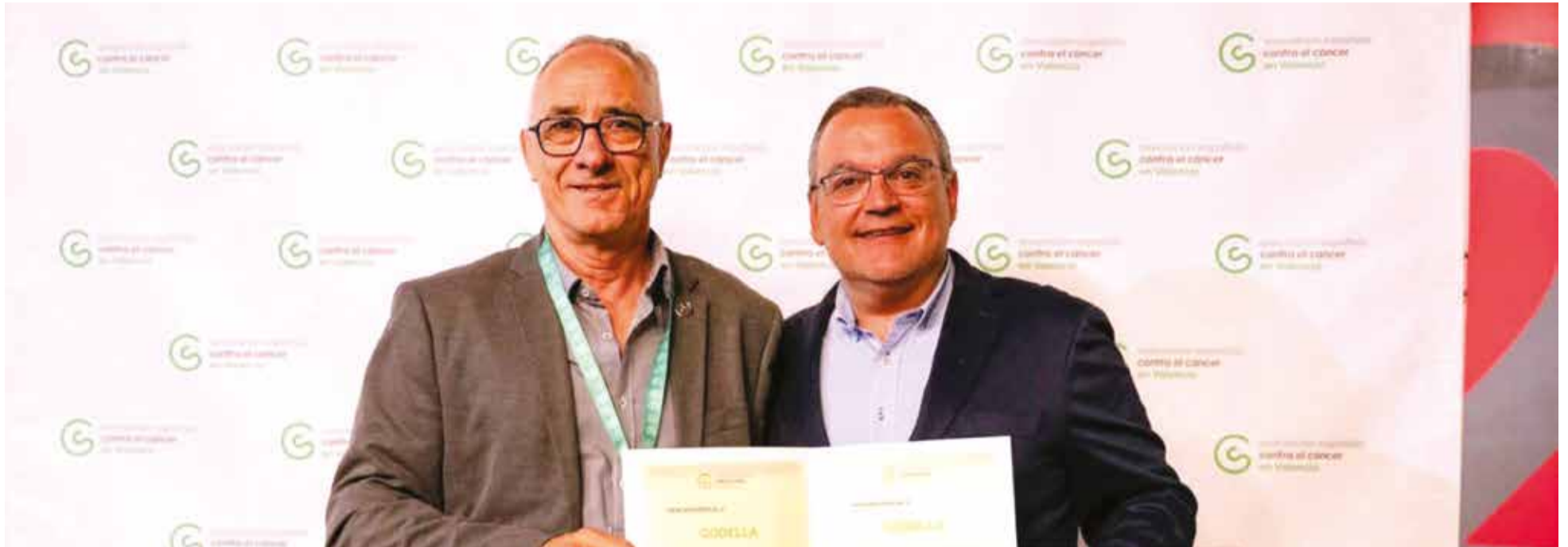
La Junta Local de l'Associació Espanyola Contra el Càncer de Godella rep dues mencions especials en la 64a Assemblea Provincial. //GMC

En el marc de la 64a Assemblea Provincial de l'Associació Espanyola Contra el Càncer (AECC) de València, la Junta Local de Godella ha sigut protagonista indiscutible en rebre dos prestigiosos reconeixements per la seua extraordinària labor recaptatòria i social durant l'exercici de 2025.