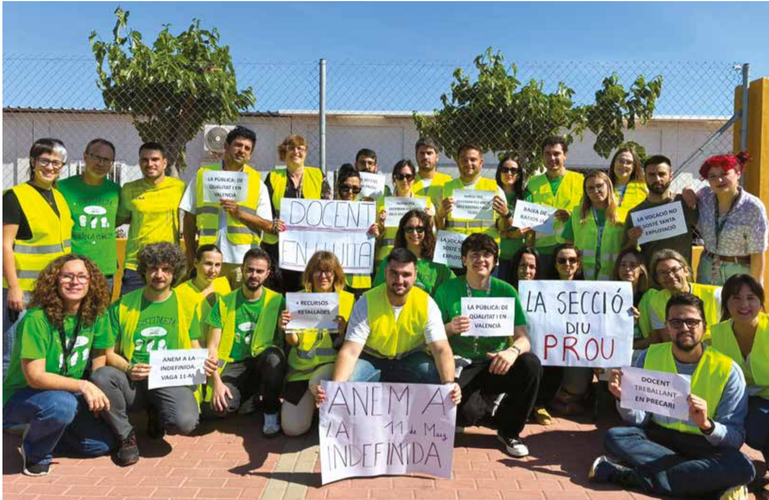
Diversos dels participants de la vaga d'Educació posant per a una foto mentre es manifestaven.

VAGA EDUCACIÓ La ruptura del bloque sindical acelera el acuerdo para terminar con la huelga indefinida