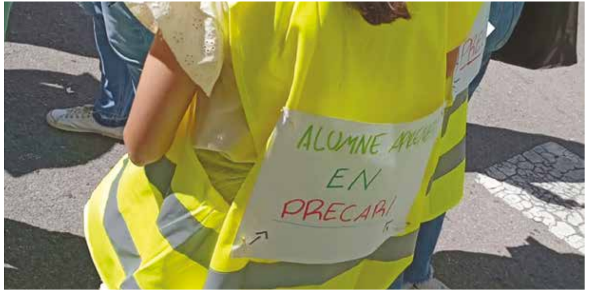
Una xica durant una concentració d'Educació a València.

La educación pública valenciana vive uno de sus momentos más tensos: huelgas, falta de recursos y negociaciones abiertas