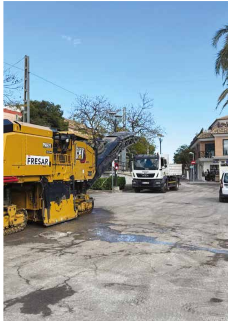
La plaza de La Canyada asfaltada.

La Canyada no necesita parches electorales cada cuatro años; necesita un plan de barrio real, sostenido y con presupuesto.