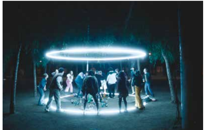
Cinema Jove selecciona nou produccions internacionals. //GMC

És el cas de Hundarna, drama suec creat per Jens Lapidus que planteja diversos dilemes ètics al voltant de l'ambició i el poder entre la plantilla d'un despatx d'advocats.