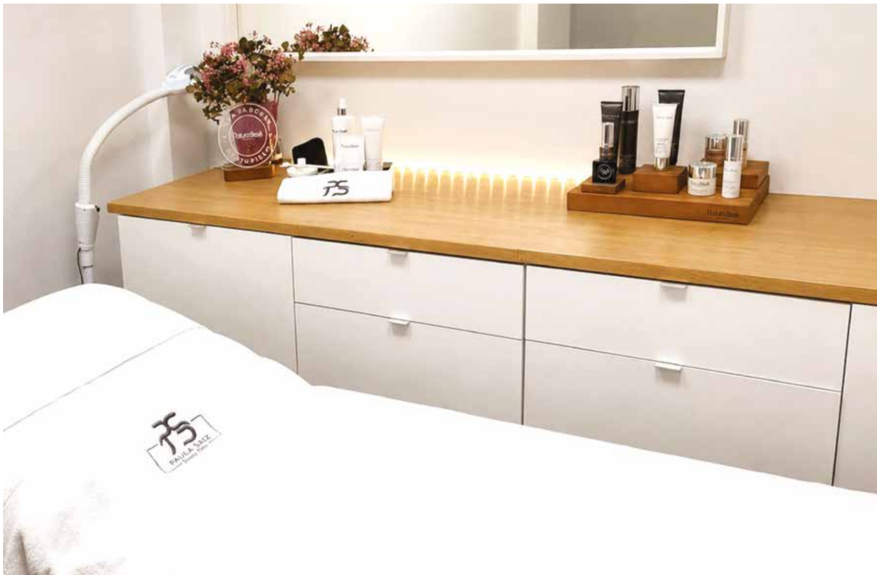
La fachada de la clínica a la izquierda y uno de los salones en su interior.

las personas sigan sintiéndose aquí como en casa. También seguir creciendo junto a mi equipo y continuar aprendiendo cada día. Eso quiere decir que no debemos perder nuestra esencia y por lo tanto, incorporaremos nuevas tecnologías y tratamientos, pero siempre manteniendo esa atención cercana y personalizada.