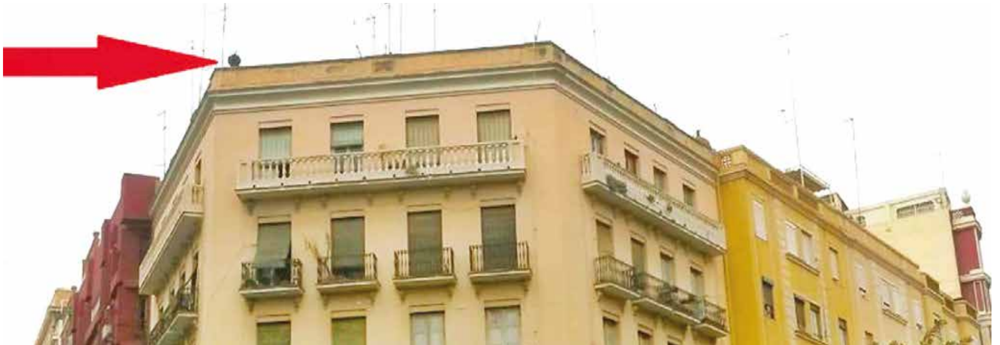
Restos de una sirena antiaérea sobreviven frente a la Finca Roja de Valencia, testigo silencioso de la Guerra Civil.

En la azotea del edificio situado en el chaflán entre la calle Martínez Aloy y la plaza Pintor Segrelles, frente a la emblemática Finca Roja en Valencia, todavía permanecen visibles los restos de una antigua sirena antiaérea utilizada durante la Guerra Civil Española.