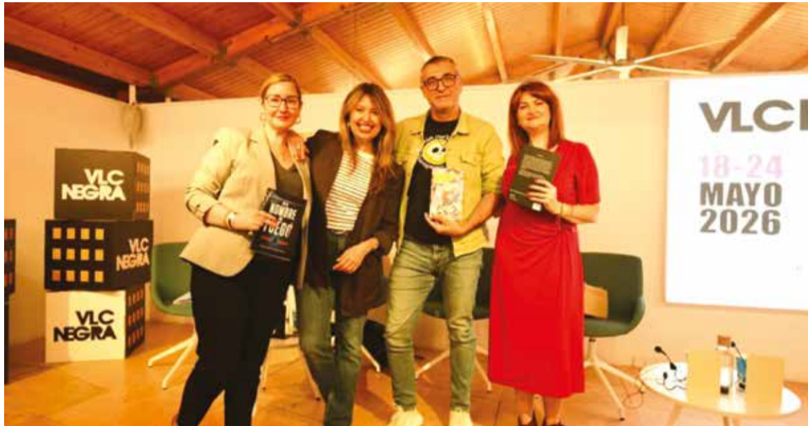
Vlc Negra Disecciona el peso de la memoria y los caprichos de la muerte para abrir su 14ª edición.