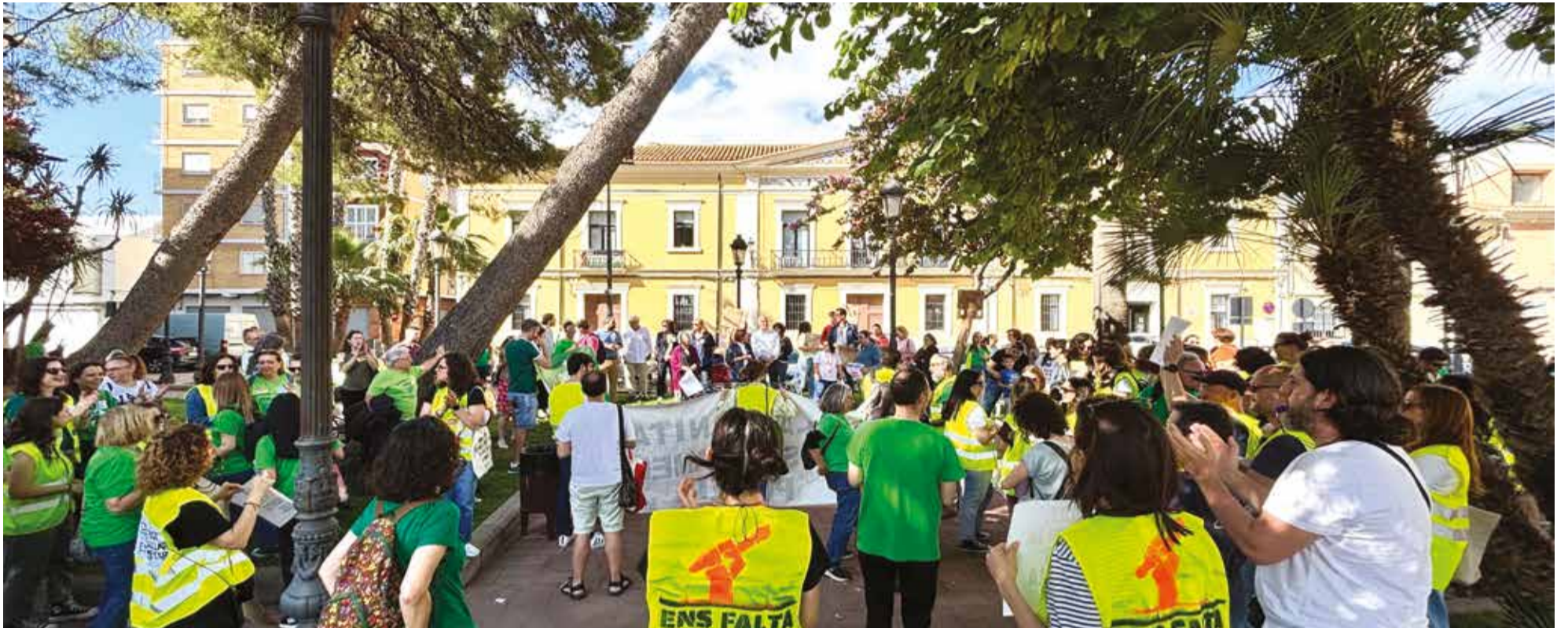
Consell escolar extraordinari de Manises per donar suport a la vaga educativa.

L'Ajuntament de Manises ha convocat un Consell Escolar Municipal extraordinari per a aquesta vesprada del 20 de maig, a les 17 hores, amb l'objectiu d'escoltar i tractar les reclamacions plantejades per la comunitat educativa, que han desembocat en una vaga indefinida iniciada l'11 de maig.