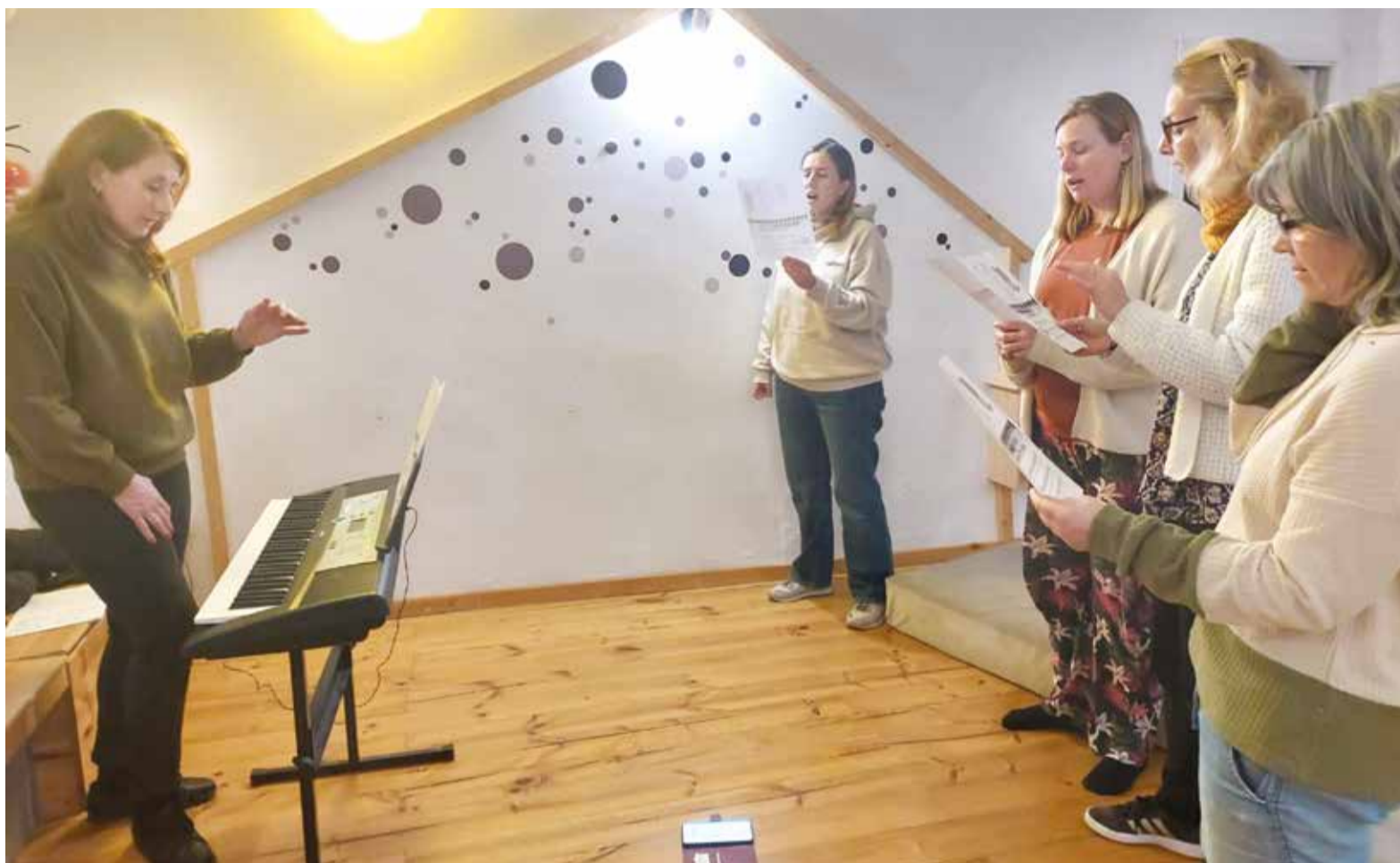
Componentes del grupo Voces de La Canyada en uno de sus ensayos.

En el corazón de La Canyada, un grupo de canto vibrante y acogedor está reuniendo a personas a través de la música, la risa y la creatividad compartida. Formado hace casi dos años, el grupo ha crecido rápidamente hasta convertirse en una comunidad muy unida donde el énfasis no está en la perfección, sino en la conexión y en disfrutar del momento.